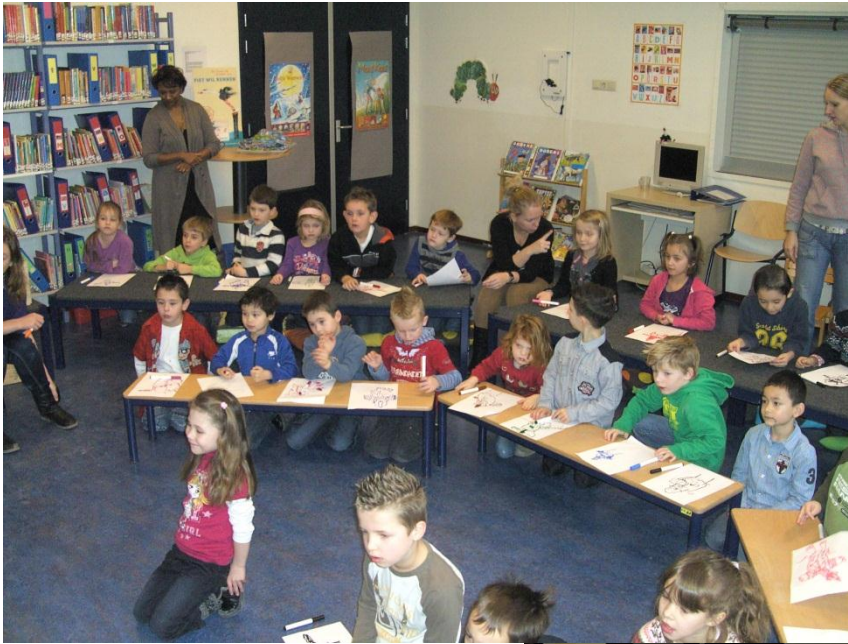
Hard aan het werk

Spuut elf is een klein brandweerolefantje die met tien grote brandweerolefanten in brandweerkazerne woont. Hij wil later heel graag brandweerolefant worden maar dat is best wel moeilijk als je iedere keer te laat bent bij iedere brand.